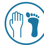
Cambios de color en los dedos de las manos o los pies