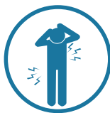
Dolores y molestias

Pero también se puede presentar otros síntomas como: