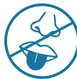
Pérdida del gusto o el olfato