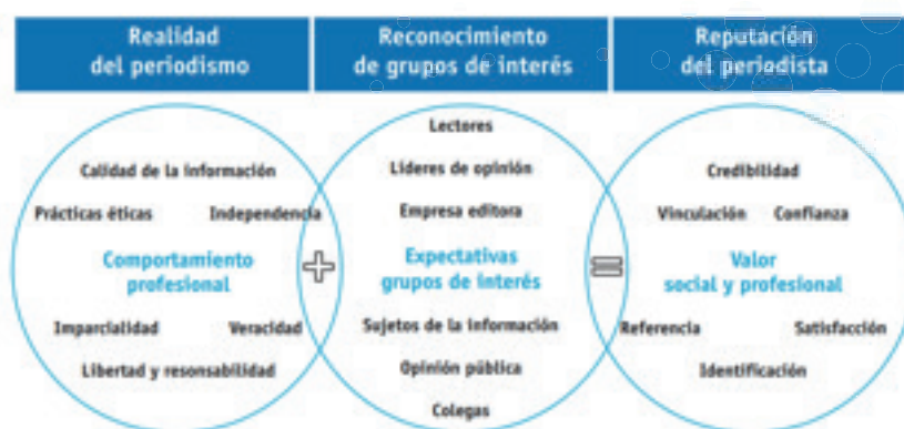
Gráfico 1: la generación de la credibilidad

Elaboración: Propia Fuente: Ortiz, 2014: 85